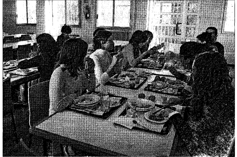
En la residencia Sant Jordi de Tarragona conviven, en la actualidad, 157 estudiantes.

Estos pisos son una nueva pieza del Campus Bellisens, destinado a agrupar la oferta universitaria de Reus, entre el Mas Iglesias y la autovía de Bellisens y al lado del